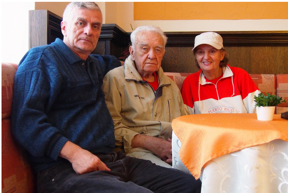
Františkovy Lázně v roce 2017.