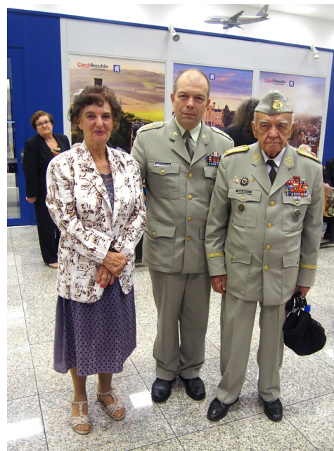
Letiště ve Kbělicích v roce 2018.