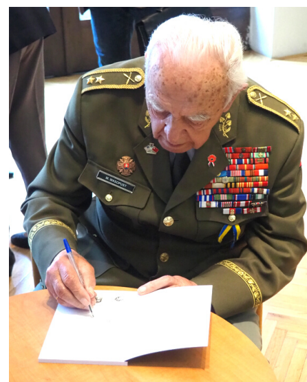
Hotel Legie, křest v roce 2022.