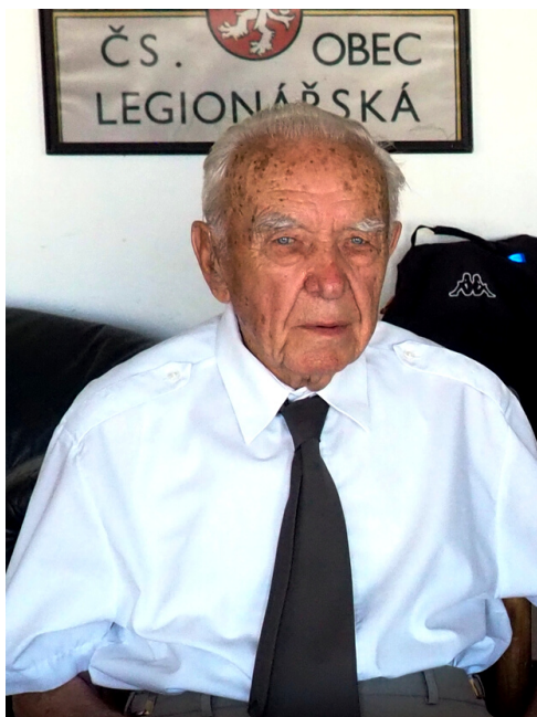
Miloslav Masopust v Hotelu Legie v roce 2023.