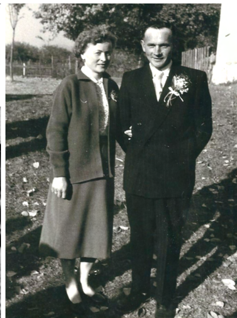
Rodiče, kteří dělali družbu na svatbě.

zdrazení elektřiny, ale ještě jsem nedostala smlouvu a pan ředitel vydal zákaz přijímání rukopisů. Takže jsem byla informována, že kniha nevyjde. Trvalo to jen půl hodiny, vzali to zpět. No a kniha se velice dobře prodává, což je cíl každého nakladatele, už má druhé vydání. Tady bych chtěla poděkovat potomkům Volyňáků, kteří na tom mají podíl. První vydání vyšlo koncem června a už 18. 8. mě upozornili, že je téměř vyprodané a že chystají druhé. To, že se blíží Vánoce, kdy vrcholí prodej knih, nehrálo až takovou roli. O knihu je mimořádný zájem.